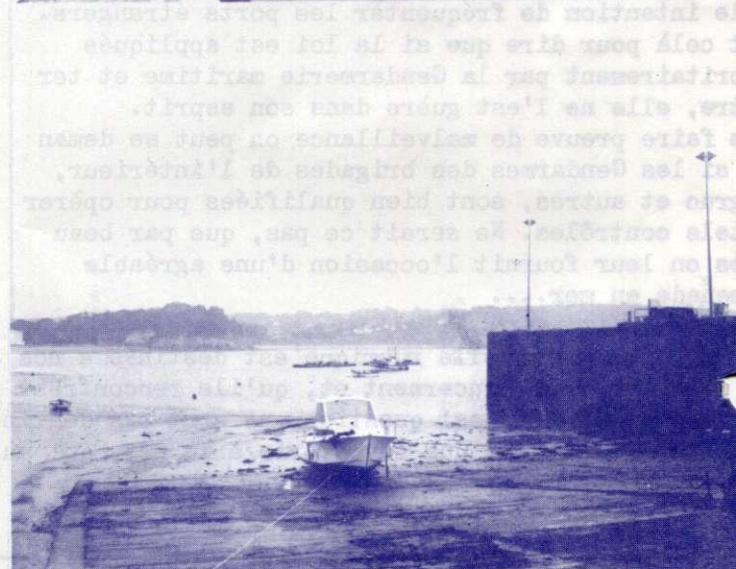
Ci-dessus, deux vues des parties ensablées.